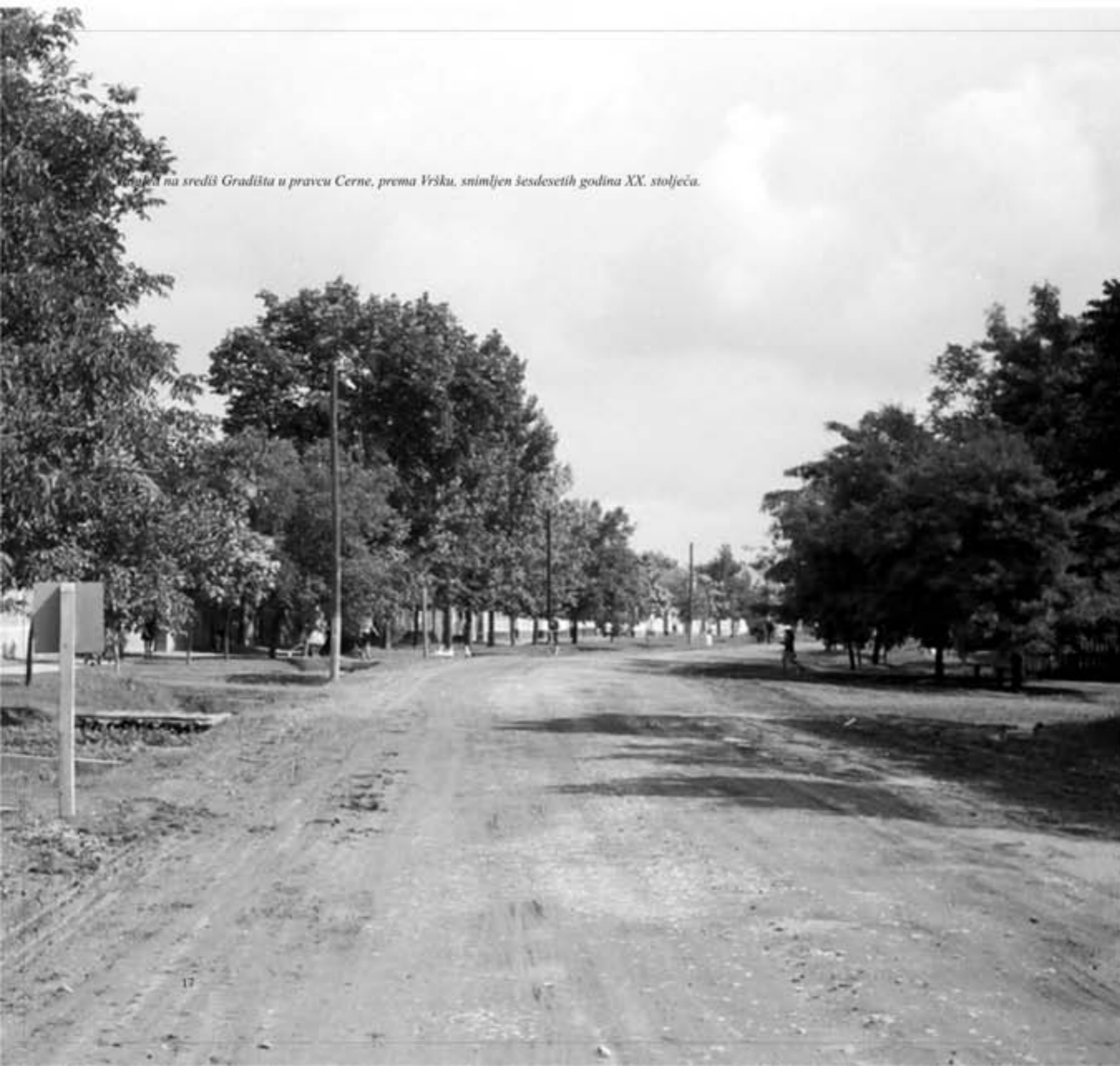
Uloga na središ Gradišta u pravcu Cerne, prema Vršku, snimljen šesdesetih godina XX. stoljeća.