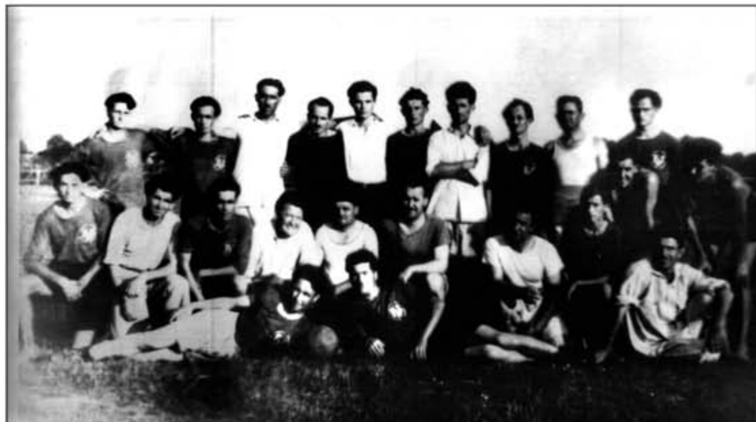
Najstarija sačuvana fotografija nastala neposredno nakon osnutka kluba 1947. godine na kojoj se nalaze osnivači kluba, članovi Uprave te prvi igrači. Igrači su u tamnim dresovima na kojima je istaknut grb kluba odnosno natpis FAS (Fiskulturni aktiv Slavonac).