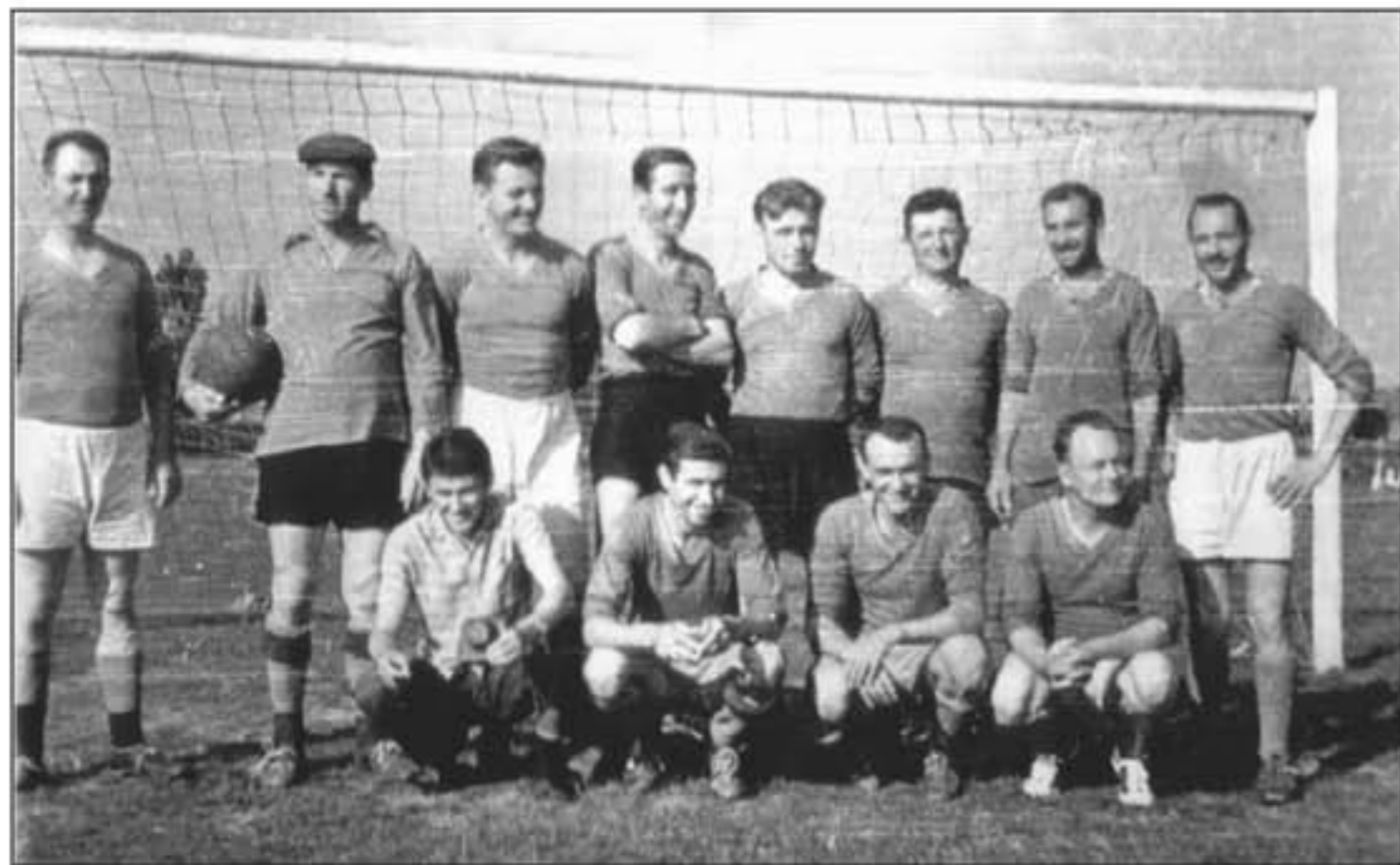
Veterani Slavonca početkom 50-tih godina.

nedugo zatim ustrojen je Oblasni nogometni odbor u Osijeku. Poslije dvije godine djelovanja, u proljeće 1950. osnovan je ponovno Nogometni podsavez u Osijeku, koji je tada obuhvaćao cijelu Slavoniju sa 107. registriranih klubova, a u tadašnjem sastavu Podsaveza nalazio se i centar u Slavanskom Brodu. 14