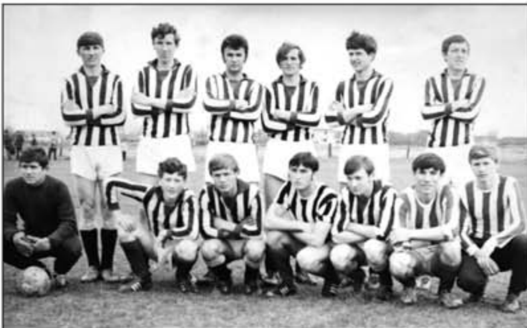
Snimljeno 1969. godine.