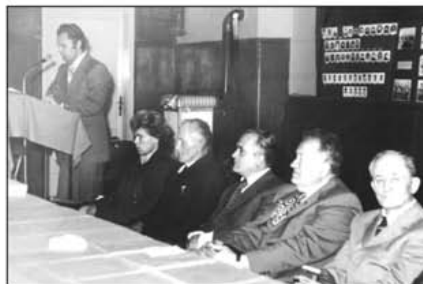
Svečana sjednica prigodom proslave obljetnice 30-te godine postojanja kluba, 26. studenoga 1977.