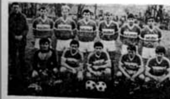
NK «Slavonac» Gradište mora čekati novu priliku

Pobjedom u osmatračnici susreta posljednjeg kola Općinske nogometne lige Županja na gostovanju kod «Posavca» u Posavskim Podgajcima nogometaši «Sloga» iz Račinovaca ostvarili su i svoj drugi ovogodišnji uspjeh. Naime, nakon ostvarenja ovogodišnjeg Kupa oslobođenja naše općine oni su postali i prvaci Općinske nogometne lige i na taj način stekli pravo na sudjelovanje u kvalifikacijama za plasman u Međuopćinsku nogometnu ligu Slavonije i Baranje. U ovim kvalifikacijskim susretima nogometaši iz Račinovaca će se sastati s prvcima Općinskih liga Vinkovci i Đakovo.