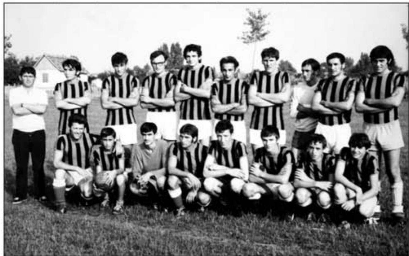
Ekipa iz Podsavezne lige

Prvi put od svoje povijesti, Slavonac se natječe u većem razredu, Podsavazu. Liga je okupljala kvalitetnije klubove s područja tadašnje županijske i vinkovačke općine, a niži stupanj natjecanja bila je Grupa iz koje se Slavonac napokon otrgnuo. U Podsavazu su uz Gradištanec još igrali: Hajduk Mirko Mirkovci, Nosterija Nuštar, Mladost Vodinci, Srijemac Ilača, Mladost Slakovci, Zrinski Bošnjaci, Šokadija Stari Mikanovci, Mladost Antin, Sloga Tordinci, Šokadija Babina Gređa, Tomislav Cerna, Krajišnik