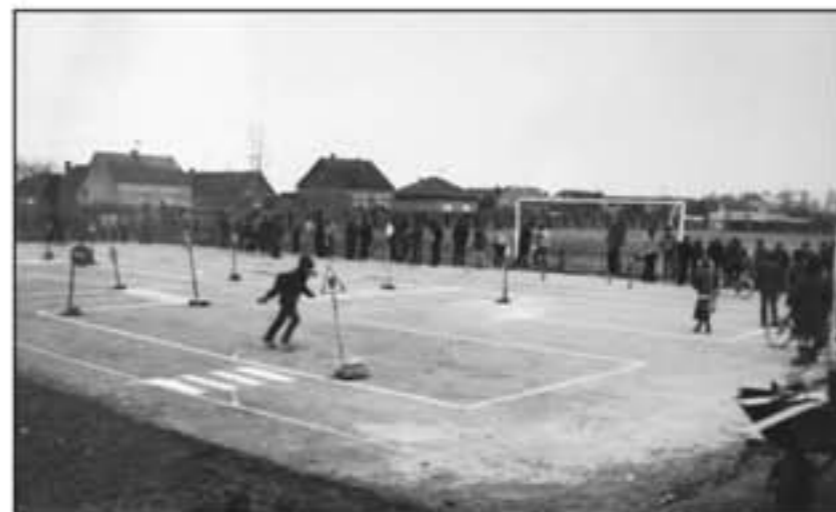
Malo nogometno igralište. U drugom planu veliko nogometno igralište ograđeno drvenom ogradom.