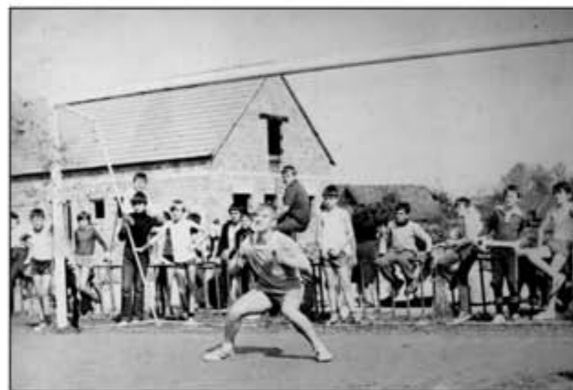
Vratnice na velikom nogometnom igralištu iza kojih se vidi mala ograda te u pozadini prostorije Nogometnog kluba koje su počete graditi 1978. godine.