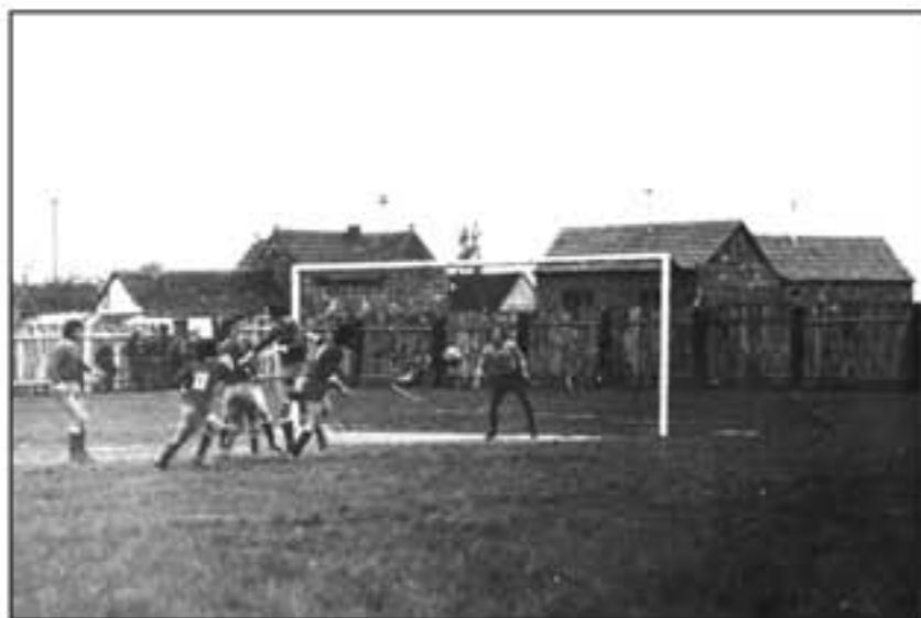
Detalj s utakmice u Gradištu.

Od ove sezone u natjecanje su bili uključeni i juniori koji su od deset ekipa na kraju zauzeli četvrto mjesto dok su pioniri od sedam ekipa bili posljednji.