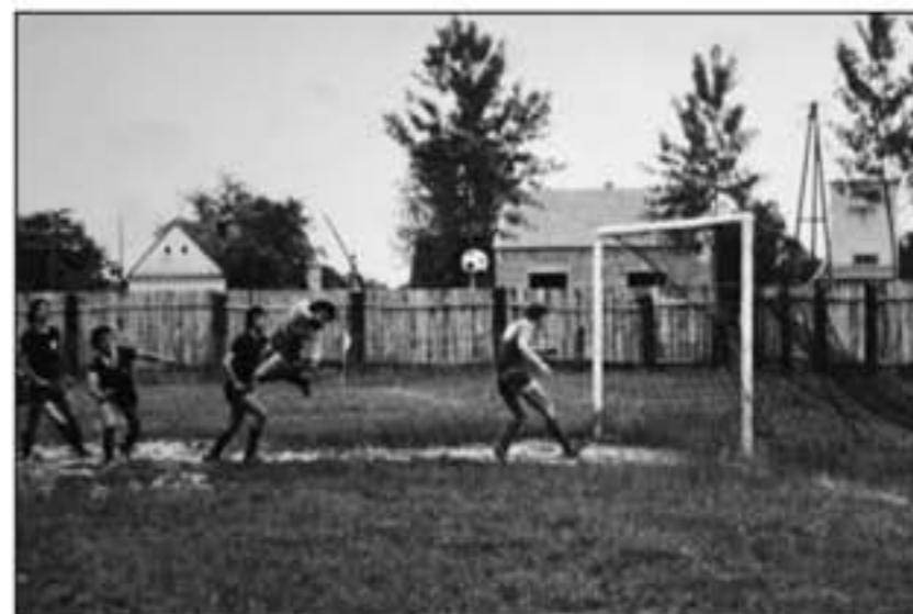
Detalj s utakmice u Gradištu.